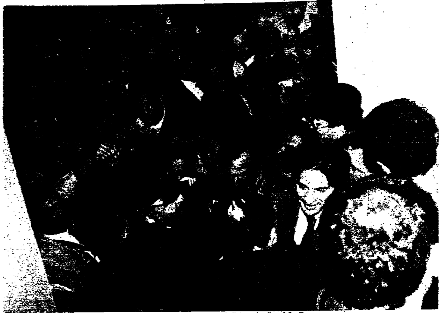
الرئيس الجميل وسط الحشود ويحاول تصالمة النائب البرزي